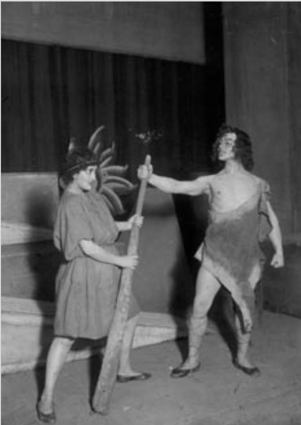
Сцена з вистави “Подвиги Геркулеса” Р. Побідимського. Режисер – С. Пронський, художники – Г. Цапок, М. Акімов. “Театр казки” (Харків), 1921 р. Друкується вперше.

ської України – Харкові – на підставі наказу № 568 ТЕО Наркомпросу 1 України з ініціативи Вищої театральної школи, створеної у тому ж таки Харкові 1919 р.[1]. Маємо всі підстави твердити, що Перший український театр для дітей та юнацтва