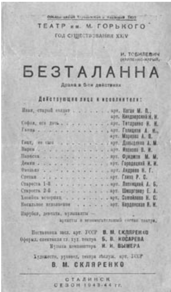
Програма вистави. Сталінськ (нині – Новокузнецьк), 1943–1944 р.

Прем'єри “Пошились у дурні” та “Кришталевий черевичок” у “Мармуровій книзі...” позначені 1945 р. – перша перед “Тарасом Шевченком”, друга – відразу після. Прем'єрою “Загибель ескадри” відкривається 1946 р.. Дати прем'єр інших спектаклів у репертуарі поки що встановити не вдалося – у “Мармуровій книзі” за ці роки вони не згадані, програмки не збереглися (ймовірно, це лише заявлені назви, які планувалися до постанови у найближчому майбутньому, як-от та ж “Загибель ескадри”). Та попри це безсумнівною залишається репертуарна спадкоємність афіші Львівського ТЮГу 1945 р., де бачимо назви вистав як 1942 – 44 років, так і довоєнного періоду.