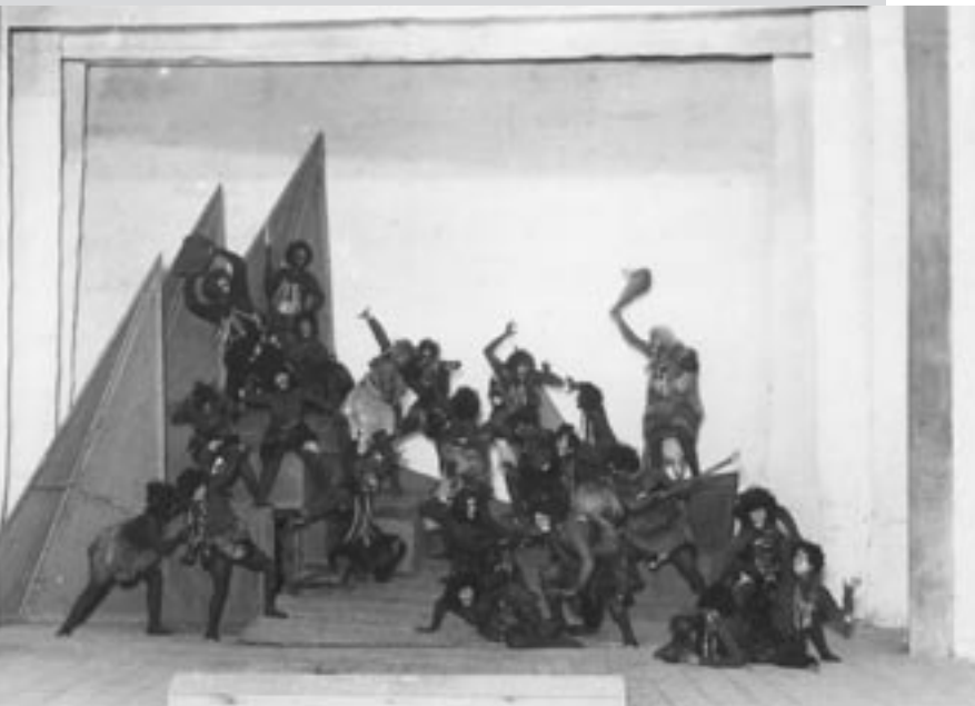
Сцена з вистави “Хубеане” Р. Побідимського. Режисер – В. Вільнер, художник – Б. Косарев. Перший державний театр для дітей (Харків), 1924 р. Друкується вперше.