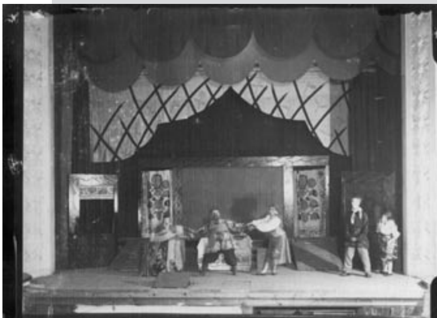
Сцена з вистави “По зорі” В. Гжицького. Режисер – І. Юхименко. Перший державний театр для дітей (Харків), 1925 р. Друкується вперше.

Досить глянути лише на фотографії вистав 20-х років, що їх дивом збережено в архіві театру, аби переконатись, що пошук відбувався на вістрі тогочасного мистецького експерименту – яскрава умовна театральність, гіпервиразна курбасівсько-мейєрхольдівська пластика, мізансценування, грим, авангардна геометричність сценографії. Відповідно формувався і репертуар, який молодому театру ще тільки належало