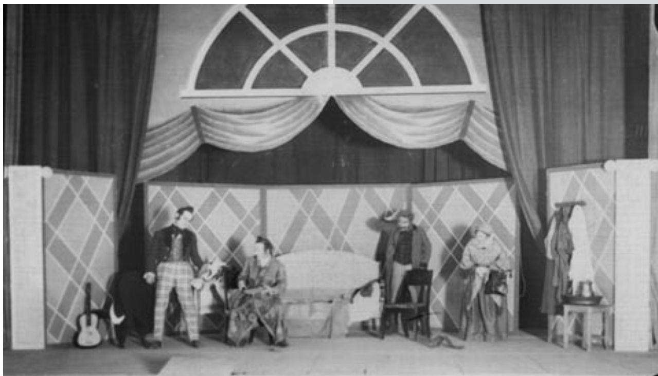
Сцена з вистави “Одруження” М. Гоголя. Режисер – І. Мар’яненко, художник – Г. Цапок. Перший державний театр для дітей (Харків), 1927 р. Друкується вперше.