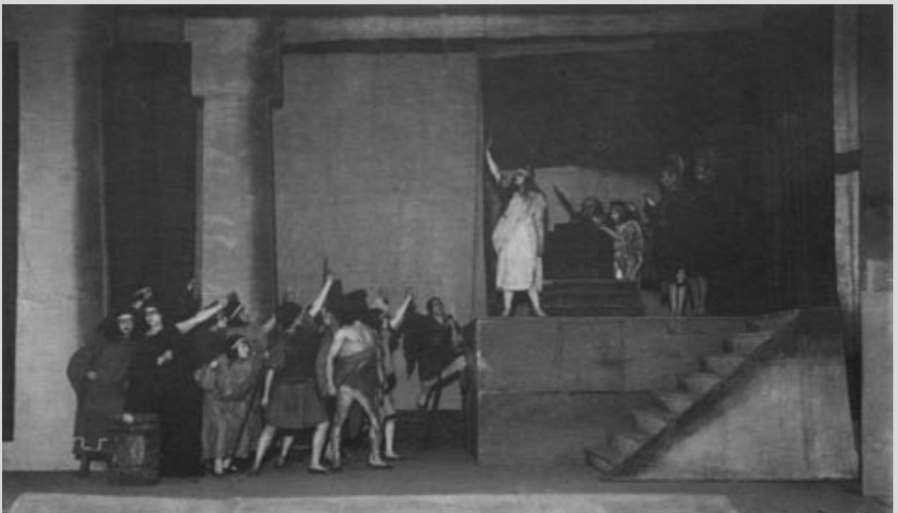
Сцена з вистави “Подвиги Геркулеса” Р. Побідимського. Режисер – С. Пронський, художники – Г. Цапок, М. Акімов. “Театр казки” (Харків), 1921 р. Друкується вперше.

Як свідчить “Історична довідка” з архіву театру, Перший український театр для дітей та юнацтва, який нині діє у Львові, було засновано в березні 1920 р. як “Театр казки” у тодішній столиці радян-