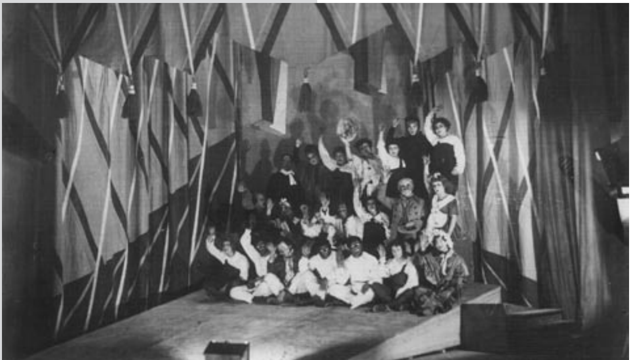
Сцена з вистави “Том Соєр” за Марком Твенем. Режисер – В. Неллі, художник – О. Хвостов. Перший державний театр для дітей (Харків), 1924 р. Друкується вперше.

дітей” [6]. А вже сумніватися в тому, що російські столичні колеги свідомо обкрадали б свою власну історію, не доводиться.