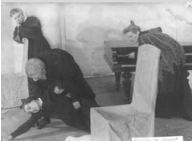
Сцена з вистави “Голубе і рожеве” О. Бруштейн. Режисер – В. Склярєнко, художники – Є. Коваленко, В. Кривошеїн. Харківський театр юного глядача ім. М. Горького, 1937 р. Друкується вперше.

у якій була зайнята більшість акторського складу (у брошурі вказано увесь діючий репертуар театру станом на поч. 1945 р., викладена коротка інформація про театр та його історію)[21]; а також брошура 1948 р. – до тривалих київських та харківських гастролей театру з переліком повного складу трупи та знову ж таки відомостями з історії театру та про 11 гастрольних вистав [22]. Також багато інформації ми почерпнемо із т. зв. “Мармурової книги прем’єр”, що до сьогодні збереглась у театрі – започаткована 1945 р., вона фіксує дати прем’єр та їхні постановочні групи від офіційного відкриття театру (хоча перелік постанов Харківського періоду поновлений, очевидно, заднім числом, а тому є неповним, і, можливо, неточним) [23].