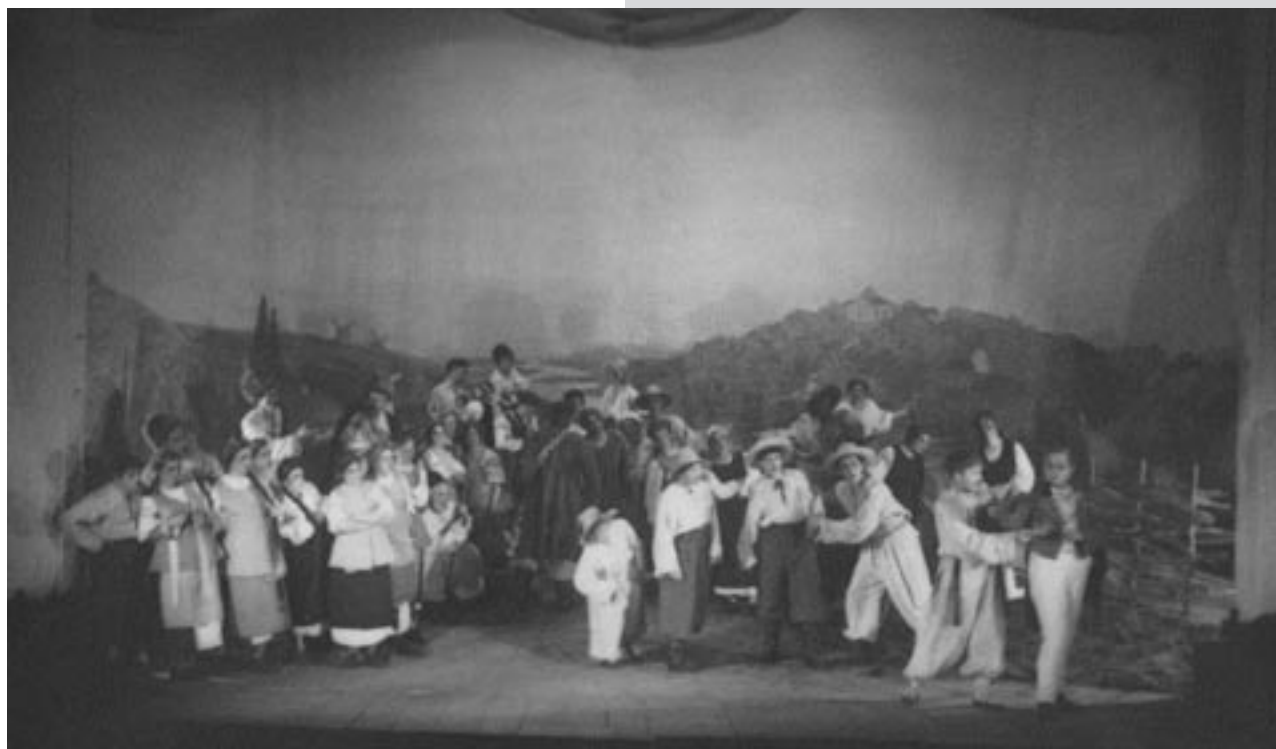
Сцена з вистави “Наталка Полтавка” І. Котляревського. Режисер – І. Мар’яненко, художник – О. Хвостов. Харківський театр юного глядача ім. М. Горького, 1936 р. Друкується вперше.

Отож, згідно з підрахунками, сезон 2009/2010 рр. для львівського Першого українського театру для дітей та юнацтва був ювілейним, 90-м, а в березні 2010 р. театру виповнилось 90 років від дня заснування. Напередодні цього ювілею у ЗМІ (переважно в інтернет-виданнях) зарясніли публікації, що іменують ювіляром передовсім нині діючий Харківський театр юного глядача як одного із двох (поряд з львівським ТЮГом) спадкоємців “Театру казки”. Так, стаття “Харківський театр юного глядача” на Вікіпедії роз-