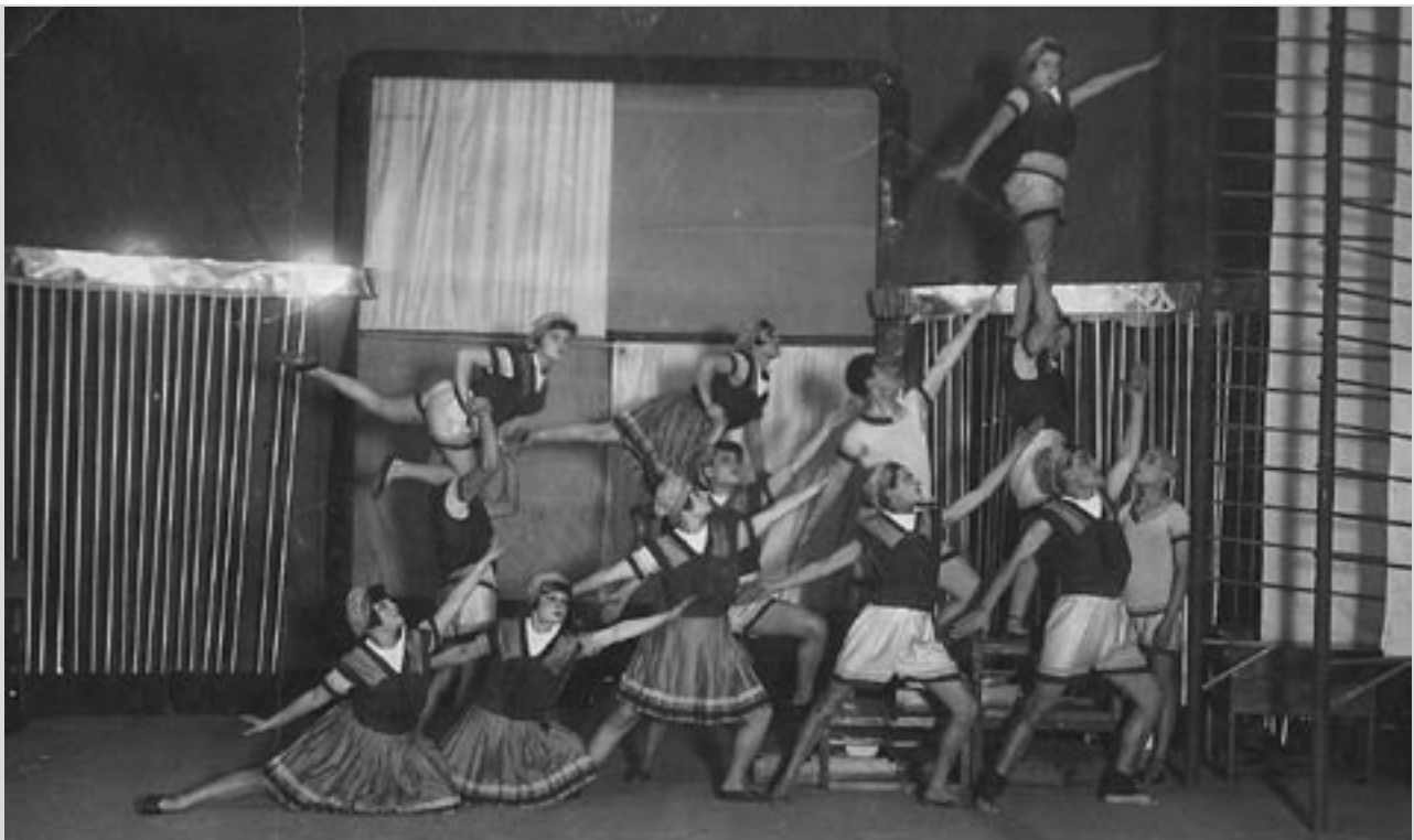
Сцена з вистави “Барaban”. Перший державний театр для дітей (Харків), 1928–1929 (?) рр. Друкується вперше.