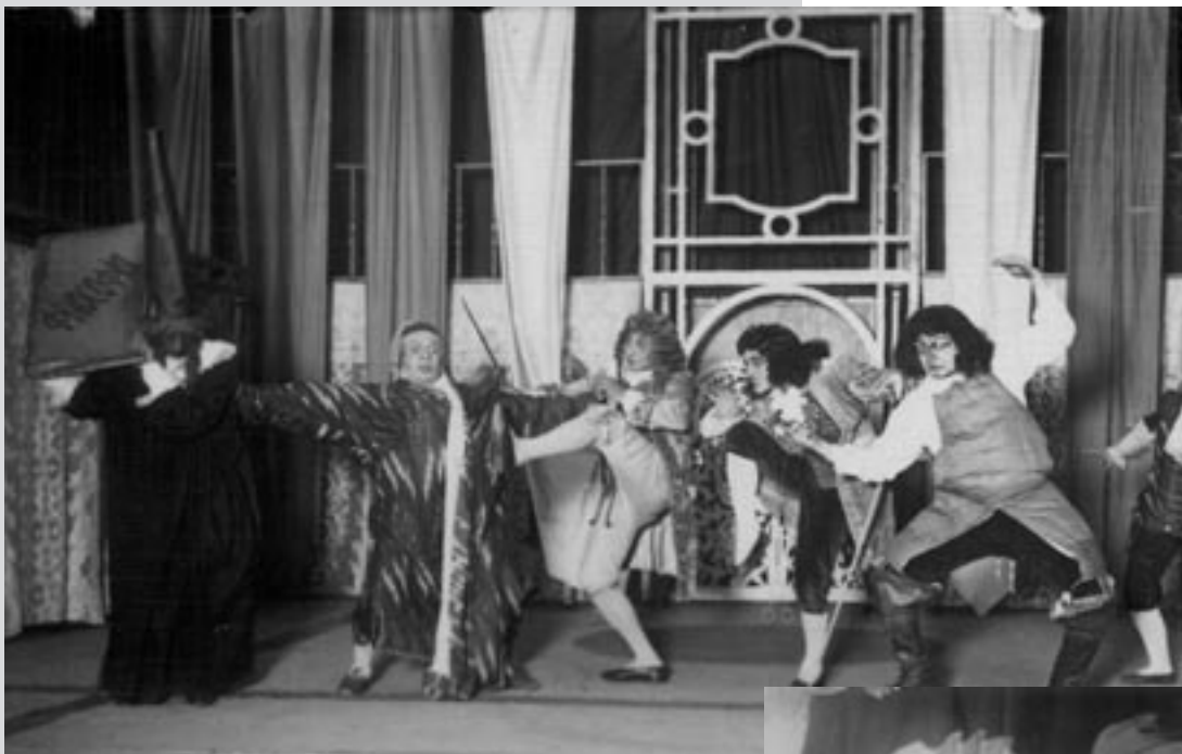
Сцена з вистави “Скупий” Ж.-Б. Мольєра. Режисер – В. Склярєнко, художник – Б. Косарєв. Харківський театр юного глядача ім. М. Горького, 1938 р. Друкується вперше.