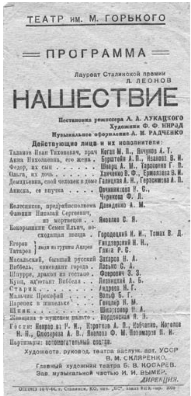
Програмка вистави. Сталінськ (нині – Новокузнецьк), 1944 р.