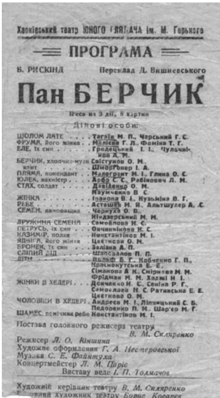
Програма вистави. 1933–1943 (?) рр.

До честі Харківського театру юного глядача, минулого року він відсвяткував свій півстолітній, а не дев'яностолітній ювілей. Але сумбур у довідковій літературі, а також очевидна тотожність назв “Хар-