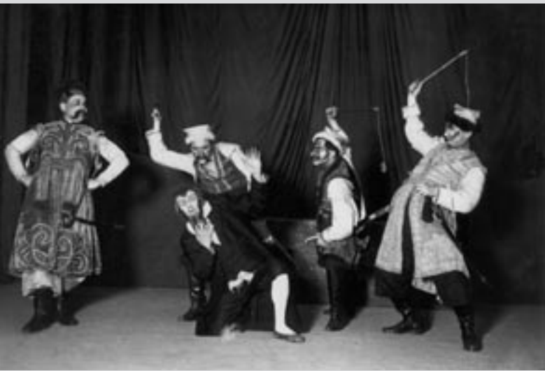
Сцена з вистави “Гайдамаки” за Т. Шевченком (інсценізація та режисура Л. Курбаса). Постановник – І. Мар’яненко. Перший державний театр для дітей (Харків), 1927 р. Друкується вперше.

творити (адже п’єси для дітей тоді було небагато, та й орієнтувався театр на початках передусім на новочасність): спеціально для “Театру казки” тодішній його завліт Олександр Білецький (а згодом – відомий український літературознавець, доктор філологічних наук, професор, дійсний член Академії наук СРСР) під псевдо Річард Побідимський пише п’єси “Подвиги Геркулеса” (п’єса-гротеск з елементами буфонади,