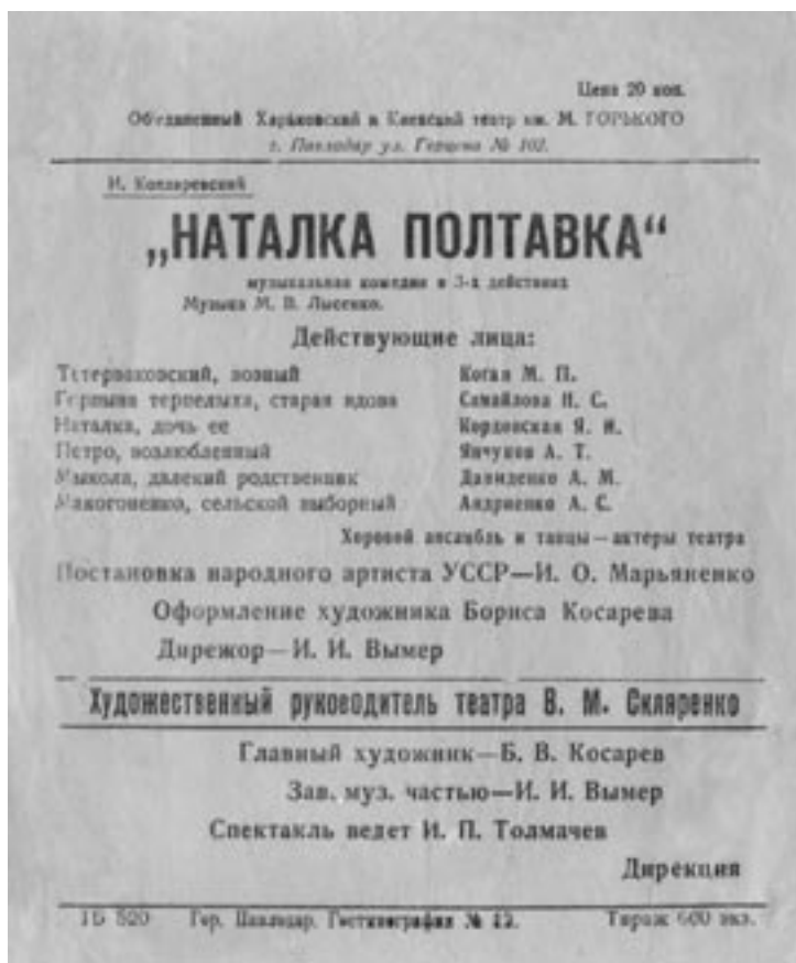
Програмка вистави. Павлодар, 1942 р.

Упродовж 1941–1944 рр. Харківський ТЮГ, як свідчать документи, періодично змінював місце свого перебування: