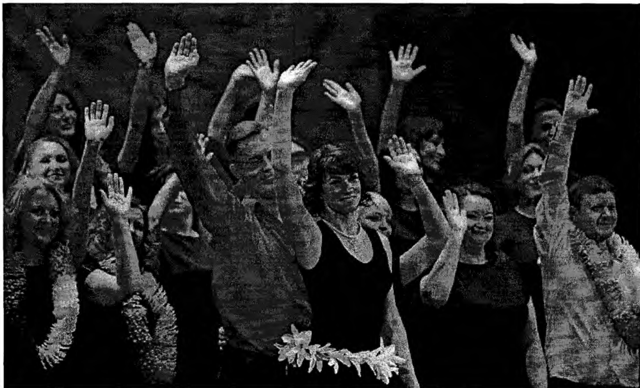
ХОРОВА КОМПОЗИЦІЯ «ТРОПІЧНИЙ КАРНАВАЛ» — ОДНА З РЕЗОНАНСНИХ ПРЕМ'ЄР МИНУЛОГО СЕЗОНУ, ЯКУ МОЖНА ПОСЛУХАТИ 13 ВЕРЕСНЯ