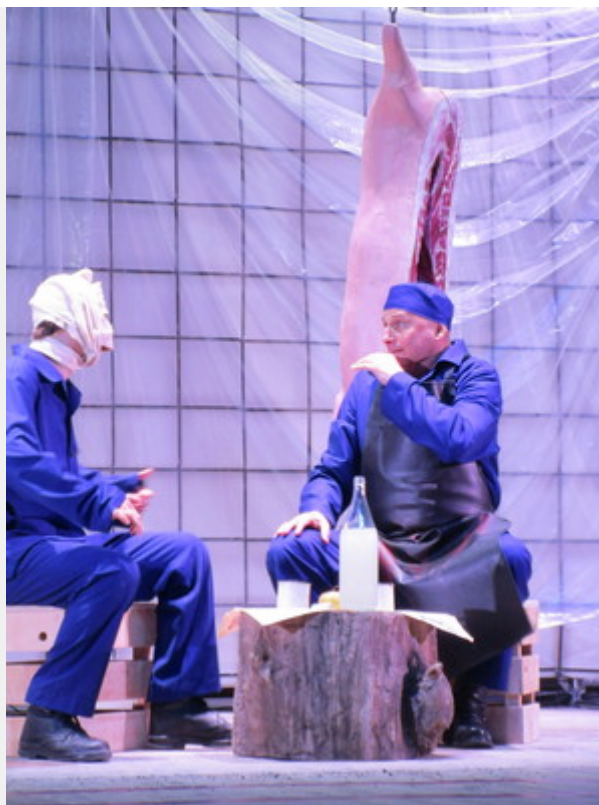
Фрагмент з вистави «П'ять пісень Полісся». Пісня друга

з переживаннями яких хотілося б себе ідентифікувати. У п'єсі відтворена абсолютно побутова реальність.