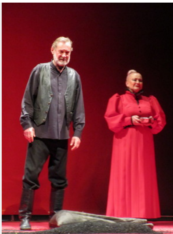
Фрагмент з вистави «П'ять пісень Полісся». Пісня перша

Сумський Національний академічний театр драми та музичної комедії ім.М.С.Щепкіна запросив глядачів на прем'єру нової вистави «П'ять пісень Полісся».