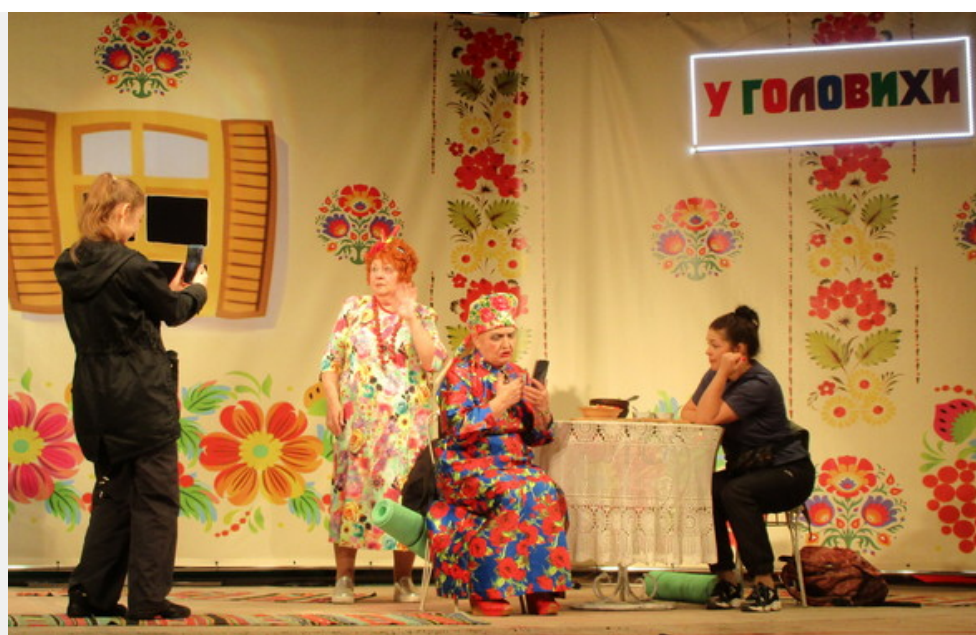
Фрагмент з вистави «П'ять пісень Полісся». Пісня п'ята

А ти дивишся на них і відчуваєш радість со-творчості, яка завжди відвідує душу поціновувача мистецтва, коли він зустрічається з чимось натхненним та безумовно талановитим. Саме такою і вийшла, на наш погляд, вистава щепкінців «П'ять пісень Полісся».